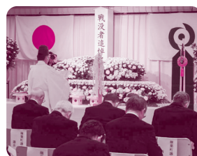
木戸八幡神社宮司による 神式祭事