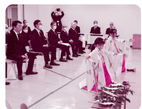
木戸八幡神社巫女による 「浦安の舞」