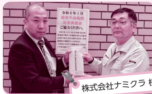
株式会社ナミクラ 様