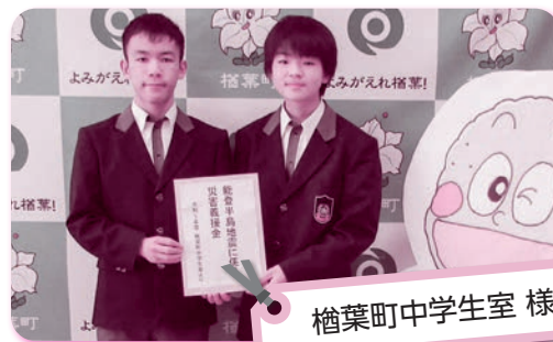
檜葉町中学生室 様