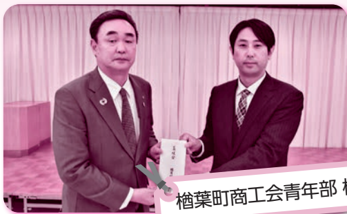
檜葉町商工会青年部 様