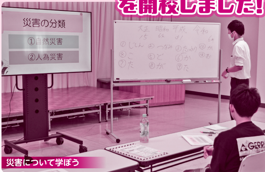
災害について学ぼう