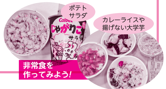
非常食を作ってみよう!

檜葉町ボランティアセンターでは、毎年夏休みを利用したボランティア活動体験の場を設け、檜葉町内の小学校高学年、中学生、高校生を対象としたサマーショートボランティアスクールを開校しています。サマーショートボランティアスクールは、住んでいる地域社会の福祉の現状を知ることや、学生たちの今後の積極的なボランティア活動への参加を促すことを目的に行っています。今後もサマーショートボランティアスクールのご参加をお待ちしております。