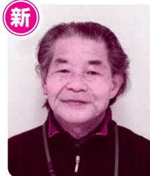
新 かりの まさひろ 狩野 正信 (山田浜)