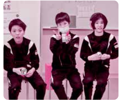
ふたば支援学校 様