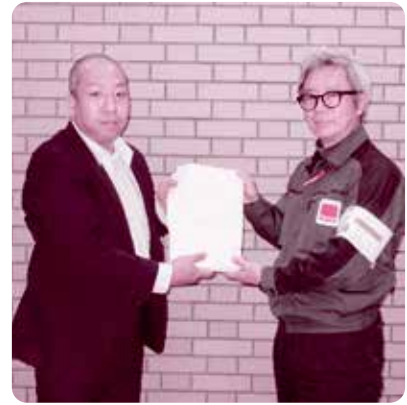
東京電力ホールディングス株式会社 様

赤い羽根共同募金運動、歳末たすけあい募金運動にたくさんの募金をお寄せいただき、ありがとうございました。募金は福島県共同募金会に全額送金し、県内の社会福祉施設、社会福祉協議会事業、福祉団体、ボランティア団体などの福祉事業の推進に配分されます。