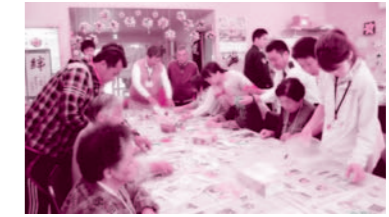
◀サポートセンター