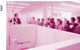
▲民生児童委員協議会