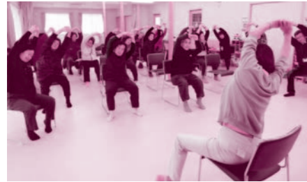
▲出張介護予防教室