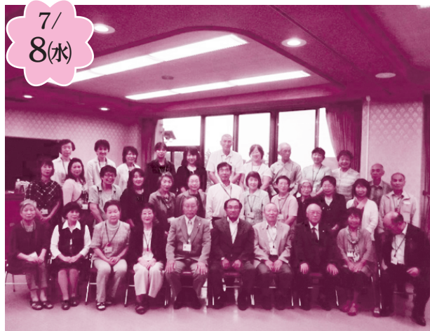
会津美里町高田地区民生児童委員協議会様