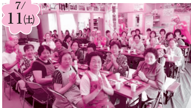
小名浜サロン(林城八反田仮設にて)