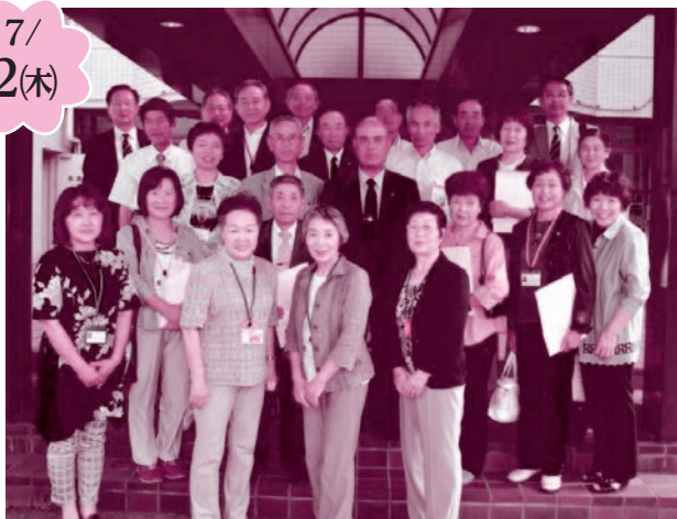
新潟県村上市神林地区民生委員児童委員協議会様