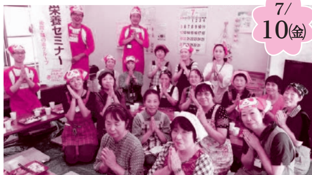
四倉サロン(四倉細谷仮設にて)