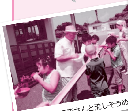
男めしの皆さんと流しそうめん