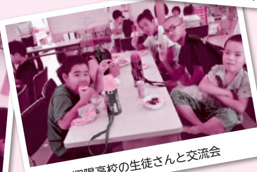
翔陽高校の生徒さんと交流会