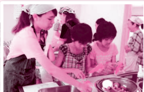
こらっせ神奈川の皆さんとすいとん作り