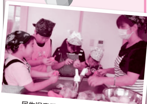
民生児童委員さんとカレー作り