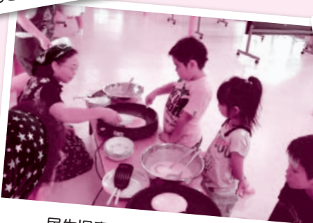
民生児童委員さんとおやつ作り