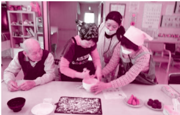
大福の皮は熱いうちにこねるため、「あっちち! あっちち」と大さわぎ。