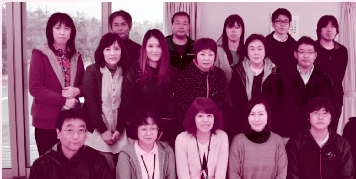
いわき・檜葉地区は私たちが訪問します

町民の皆様の心に寄り添った活動を行ってまいりますので、悩みごとや困りごと相談したいこと等がおありの際は、どうぞお気軽にお声がけ下さい。