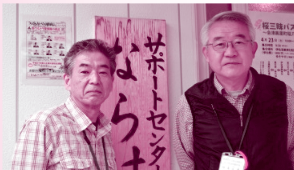
会津地区は私達が担当します