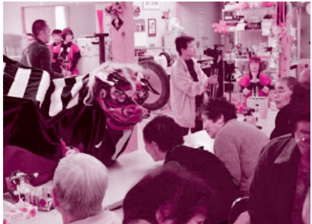
心ふるえる感動をありがとうございました

今年もはるばる長野県から和太鼓愛好団体合同チームの皆さんがたくさんのおみやげと力強い演奏で激励に来て下さいました。