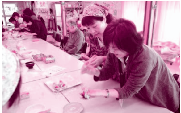
いちごが特大のため、なかなか包めず一苦労。いちごが見えてもご愛嬌。