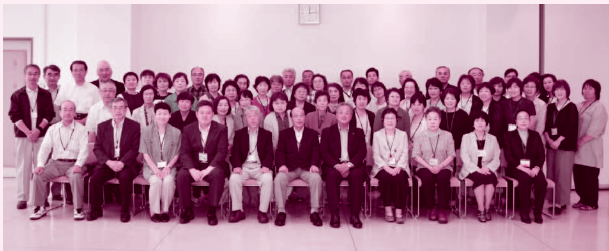
猪苗代町民生児童委員協議会の皆さんとの交流会

民生委員法に基づいた守秘義務により、相談の内容等の秘密は厳守しますので、悩みごとやお困りの時はお気軽にご相談ください。