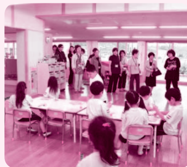
あおぞらこども園訪問