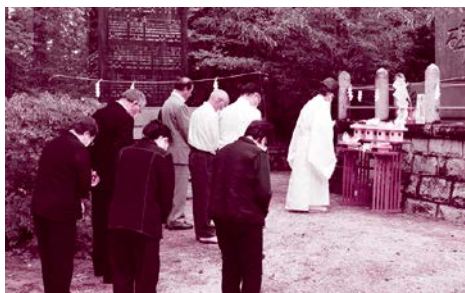
木戸八幡神社・竜田神社において戦没者の御霊の慰霊を行いました。