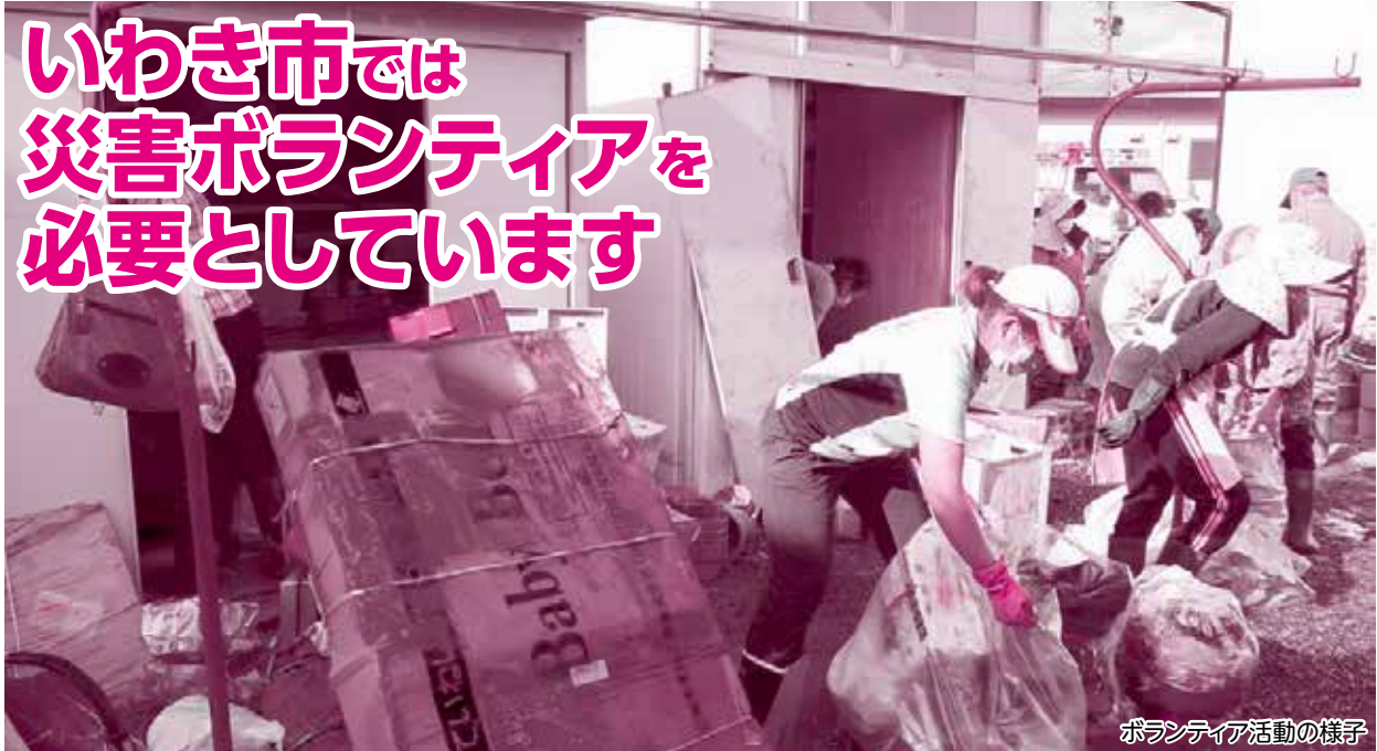
ボランティア活動の様子

令和5年9月8日の豪雨による被害に伴い、いわき市社会福祉協議会では災害ボランティアセンターを開設し、ボランティアの方々による活動が進められております。檜葉町社会福祉協議会ではホームページへ災害ボランティアセンター立ち上げのお知らせを掲載するほか、運営支援として、当日参加されたボランティアの方々の活動場所への送迎や、被災者宅訪問活動への協力を行っております。